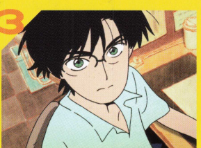
3 ファーストラマン 監督: ちな