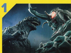
1 ゴジラ vs メガロ GODZILLA vs. MEGALON 監督: 上西琢也