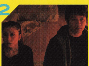
2 knot 監督: 平瀬遼太郎