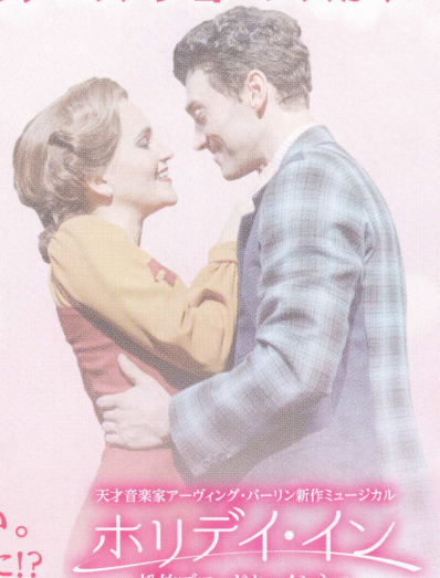
天才音楽家アーヴィング・バーリン新作ミュージカル

本作は、ビング・クロスビーとフレッド・アステアが主演する1942年のミュージカル映画「ホリデイ・イン（邦題：スイング・ホテル）」を舞台化したものです。原作のために作られ、今なお人々に愛される天才音楽家アーヴィング・バーリンの曲と詩と共に、ゴードン・グリーンバーグとチャド・ホッジが執筆した新たな脚本で、スクリーンの不朽の名作が舞台でよみがえりました。この作品の為に作られたブロードウェイの永遠の名曲であり、誰もが知っている「ホワイト・クリスマス」他でつづられたアーヴィング・バーリンの傑作ミュージカル『ホリデイ・イン』をいち早く“映画館”でご堪能ください。