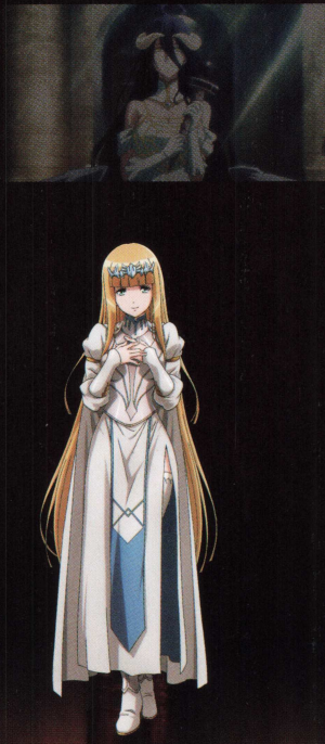
カルカ CV: 早見沙織

聖王国騎士団の団長で、同国最強の聖騎士。妹のケラルトと共にカルカに絶対的な忠誠を誓い支えている。