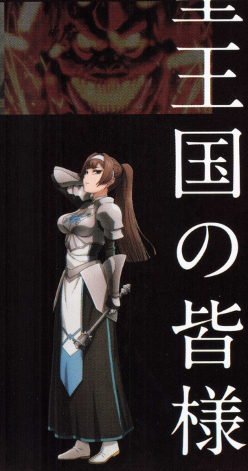
ケラルト CV: 戸松遥

聖王国の当代の聖王にして史上初の女王。ローブルの至宝と評されるほどの美貌を誇り、善良かつ慈愛に満ちた人格で国民から支持を得ている。