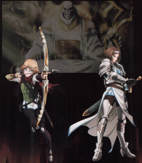
ネシア CV: 青山吉能

聖騎士団の従者。母親のような聖騎士に憧れているが、剣の才能に乏しくレメディオスからさまざまな扱いを受けている。