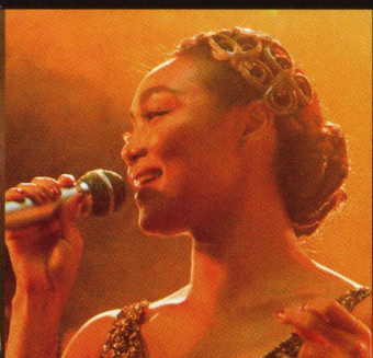
クリスタル・ケイ