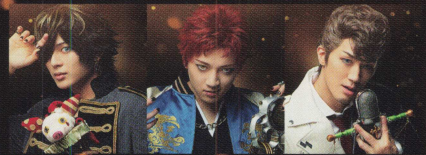
四十物 十四 加藤 大悟 波羅夷 空却 廣野 凌大 天国 獄 青柳 壘斗