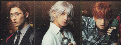
入間 鏡兎 水江 建太 碧棺 左馬刻 阿部 顕嵐 毒島 メイソン 理彥 バーンス 勇気