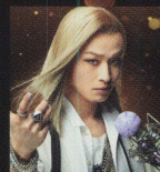
大蜘蛛 弾華 植野 妮 誠