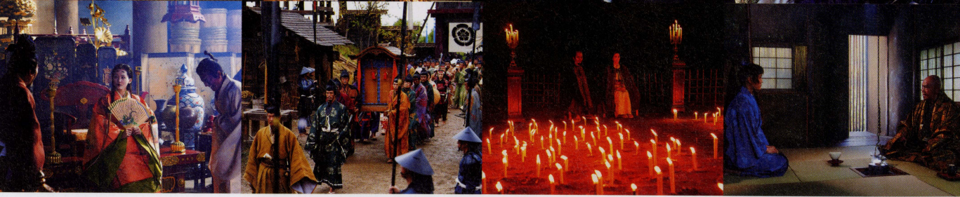
織田信長 [木村拓哉] 濃姫(神蝶) [綾瀬はるか] 明智光秀 [宮沢氷魚] 森蘭丸 [市川染五郎] 木下藤吉郎(羽織秀吉) [音尾琢真] 徳川家康 [斎藤工] 斎藤道三 [北大路欣也] 福富平太郎貞家 [伊藤英明] 各務野 [中谷美紀]