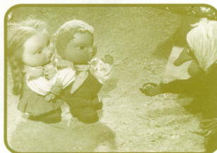
ボヤル『魔法の森のお菓子の家』

配給: チェスキー・ケー/レン コーポレーション 「ほくらと遊ぼう」のホームページアドレス http://plaza19.mbn.or.jp/~rencom