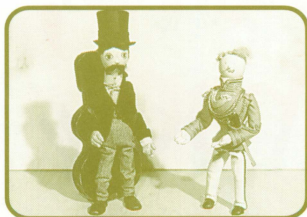
トルンカ『コントラバス物語』