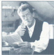
イアンニス (ジョン・ハート) 島の医師でペラギアの父親。娘のコレリに対する思いを知り、温かく見守る。

上映時間：2時間9分 / 原作：東京創元社刊 / スクリーン・プレイ：アルカ・シネマ・シナリオシリーズ / オリジナル・サウンドトラック：ユニバーサル ミュージック 配給：ブエナビスタ インターナショナル(ジャパン) ©2001 UNIVERSAL STUDIOS, STUDIOCANAL AND MIRAMAX FILM CORP.