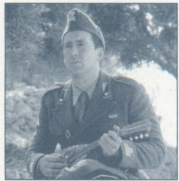
アントニオ・コレリ (ニコラス・ケイジ) イタリア陸軍大尉にして、人生と音楽をこよなく愛するマンドリン奏者。

戦争という悲劇の中にあっても、マンドリンを手に音楽を愛し、恋を追い求めた男、アントニオ・コレリ大尉役に、ニコラス・ケイジ。彼と恋におちる島の娘ペラギアに、「オール・アバウト・マイ・マザー」のペネロペ・クルス。また、ジョン・ハート、「アメリカン・サイコ」のクリスチャン・ベールといった豪華キャストが集結し、ドラマティックに人間模様を織りなしていく。