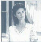
ペラギア (ペネロペ・クルス) 情熱的で聡明な島の医師の娘。敵兵であるコレリとの愛に苦悩する。