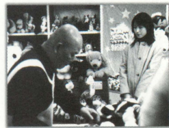
★大阪のおもちゃ屋 丸亀玩具の一押しは"かめへん人形"