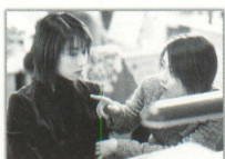
★大阪のOLは 新しいじめもおてのもの!?