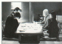
★大阪の接待には 阪急ブレイブズを話題にしる

この出会いは夢のように、風のように、一瞬で過ぎ去ってしまったけれど、 あなたの存在が確かに残っている。あなたがココニイルコト、そして私がココニイルコト。 何億光年離れても、そのことを忘れない――。