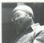
★古道具屋のおじさんは、 いつも居残り