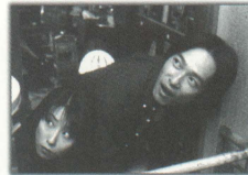
★アパートからは何故か昼でも星が見える