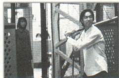
★バッティングセンターはデート必須コース