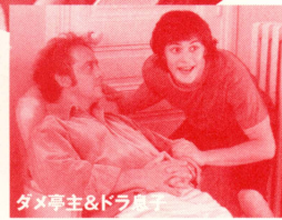
ダメ亭主&ドラッグ