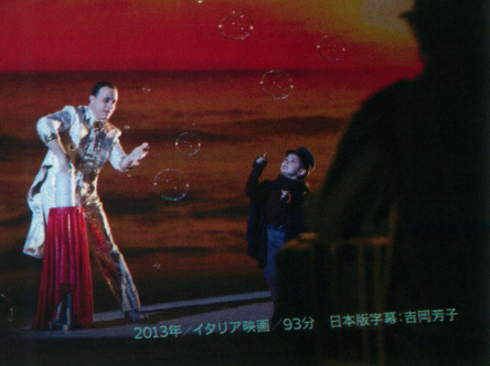
2013年/イタリア映画・93分 日本語字幕・吉岡秀子

ムッソリーニの抬頭と戦争を挟み、11歳の年齢差はあっても 二人は編集部で机を並べ、以後、数十年にわたり友情を育んだのであった