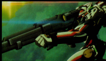
最重要秘匿 KLF (Kinetic Levitating assault Fighter) AΩ級0系統 (通称 オリジネート・ゼロ)

公共福祉査察軍生化学即応軍に所属する科学者で、レントンの父。スカブコーラルを殲滅するネクロシス作戦を立案するが、その途中で、ある考えを持って反乱を始める。エウレカのことを娘のように慮っていた。死後はサマー・オブ・ラブの危機から世界を救った英雄として讃えられている。