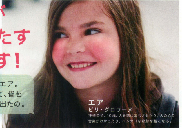
エア ピリ・グロワヌ 神様の娘。10歳。人を恋に落ちさせたり、人の心の音楽がわかったり、ヘンテコな奇跡を起こせる。

神様(パパ) ブノワ・ポールヴェルド パソコンで面白半分事故や 天災を起こしたりする嫌なやつ。