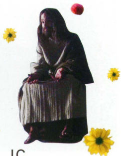
JC イエス・キリスト エアの兄。かつて人間界へ家出をした救世主。いまはなぜか置物だけど、エアの良き相談相手。