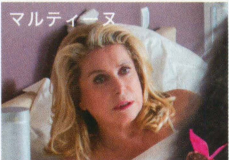
マルティヌ 余命5年2ヵ月17日。 夫と冷めた関係の寂しい主婦。ゴリラと恋に落ちる。