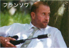
フランソワ 余命25年3ヵ月8日。 保険屋だったが余命を知ってこっそりスナイパーに転職。