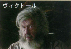
ヴィクトール ホームレス。家出したエアを助ける。携帯を持たないから余命を知らず、興味もない。