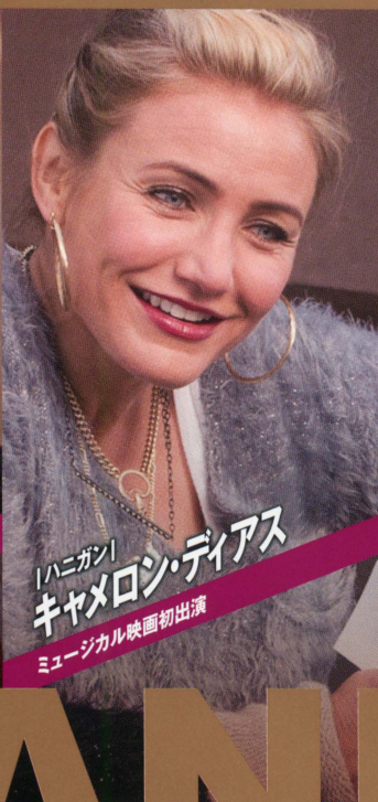
「ハニガン」 キャメロン・ディアス ミュージカル映画初出演