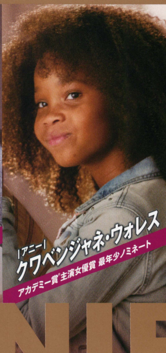
「アニー」 クワベンジャネ・ウォレス アカデミー賞 主演女優賞 最年少ノミネート