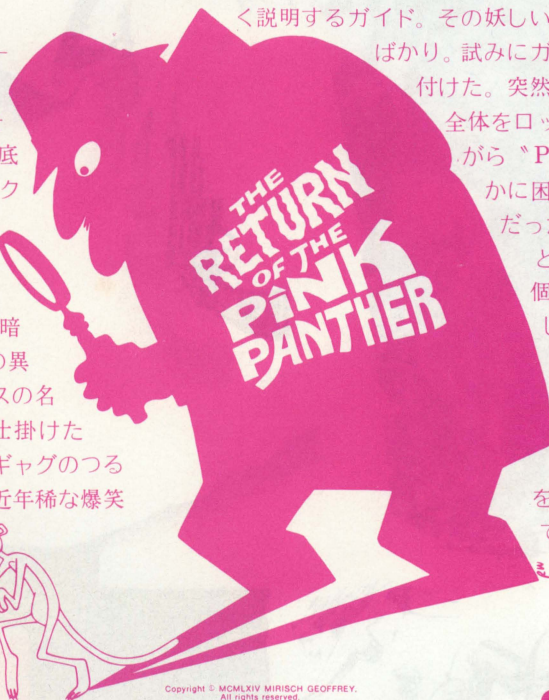
Copyright © MCMXLIV MIRISCH-GEOFFREY. All rights reserved.

ート・ロムがクルーゾーの不条理な行動に神経を逆撫でされるドレフュス署長を好演。そして怪盗ファントムに「らせん階段」のクリストファー・プラマー、その妻に「ダブル」の新星カトリーヌ・シェルが色を添える。マラケシュ、カサブランカ、ニース、グシュタート(スイス)とカラフルなロケ撮影を担当したのは「キャバレー」「オリエンタル急行殺人事件」の名手ジョフリー・アンズワース。音楽は第一作以来のヘンリー・マンシーニで、得意の中東調でムードを盛り上げている。