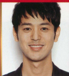
OHTA Kiichiro SATOSHI TSUMABUKI