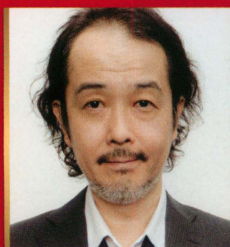
KAGAMI-san LILY FRANKY

果たしてグランプリの栄冠は誰の手に? “偽夫婦”を演じる太田とひかりの恋の行方は?そして、陰謀渦巻く審査会に翻弄される主人公・太田が最後につかんだものとは…? 2014年、笑いと驚きと感動の最強エンターテインメントが誕生する!