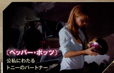
【ペッパー・ポッツ】 公私にわたる トニーのパートナー