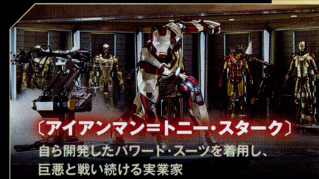
【アイアンマン=トニー・スターク】 自ら開発したワード・スーツを着用し、 巨悪と戦い続ける実業家