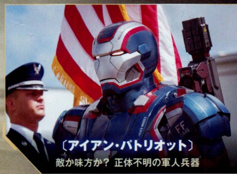
【アイアン・パトリオット】 敵か味方か？ 正体不明の軍人兵器