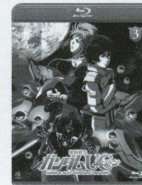
episode 3 「ラプラスの亡霊」