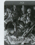
episode 4 「重力の井戸の底で」

【スタッフ】原作：矢立 肇・富野由悠季「機動戦士ガンダム」より / 監督：古橋 浩 / 脚本：むとうやすゆき / ストーリー：福井晴敏 / オリジナルキャラクターデザイン：安彦良和 アニメーションキャラクターデザイン：高橋久美子 / モビルスーツ原案：大河原邦男 / メカニカルデザイン：カトキハジメ・石垣純哉・佐山善則・玄馬宣彦 / 音楽：澤野弘之 / 企画・製作：サンライズ 【キャスト】バナージ・リンクス：内山昂輝 / ミネバ・バラオ・ザビ(オーディーバーン)：藤村 歩 / リディ・マーセナス：浪川大輔 / マリーダ・クルス：甲斐田裕子 / スベロア・ジノネマ：手塚秀彰 / ブライト・ノア：成田 剣 他