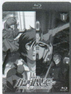
episode 1 「ユニコーンの日」