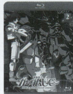
episode 2 「赤い彗星」