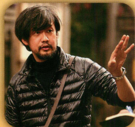
山崎 貴 (監督・脚本・VFX)

シリーズ初の3Dで制作されることで、 前2作以上に昭和の世界にタイムト リップする感覚を味わって頂く事が出 来ます。全ての世代の方たちに楽し んで頂ける作品です。ご期待下さい！