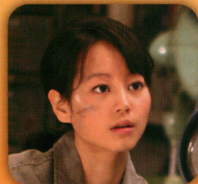
堀北真希 (星野六子 役)

あの、ALWAYSがまた、皆さんの心 に帰ってきます。今回も、三丁目 で繰り広げられる様々な人間模様を、 スタッフ一同、丁寧に描いていき たいと思っています。