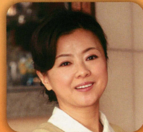
薬師丸ひろ子 (鈴木トモエ 役)

昭和39年、三丁目の子供たちも 思春期となり、宅間先生もアクマと 呼ばれなくなりました。さて、いよいよ 東京オリンピックです。夢と希望に燃 えていたあの頃の日本。お楽しみに。