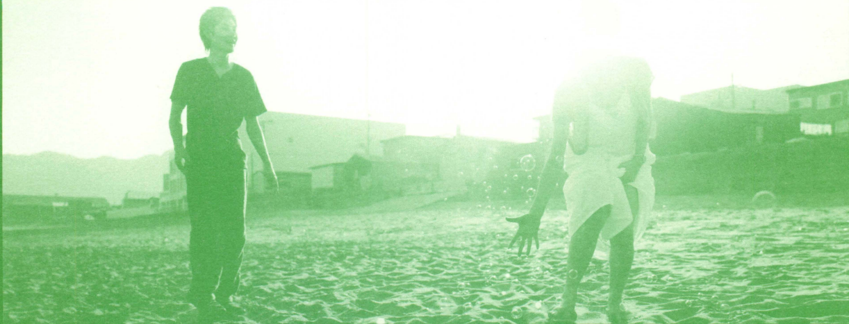
Matsuda Ryuhei in "スナフキン リバティ"