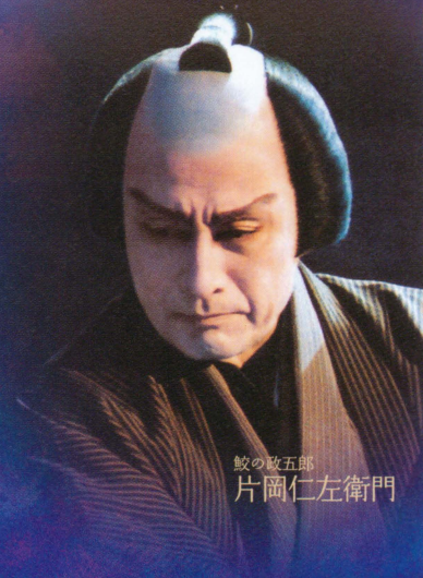
鯨の政五郎 片岡仁左衛門