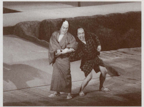
シネマ歌舞伎とは—