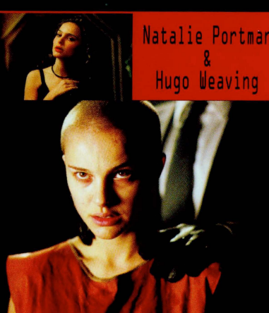
Natalie Portman & Hugo Weaving

ヒロイン、イヴィーを演じるのは、『スター・ウォーズ』エピソード1~3に主演したナタリー・ポートマン。イヴィーは幼い頃に、反政府活動に加わっていた両親を殺害されて以来、目立たぬよう、息を潜めるように暮らしてきた平凡なOLだ。しかし、「V」との出会いが彼女の人生を大きく変えていく。テロ共謀の容疑で監禁され、拷問すら受ける中で、彼女の内に目覚めていく意志と尊厳。ポートマンは拷問シーンで本当に髪を刈り上げられることになった。一度剃ってしまったら撮り直しのきかない緊迫のシーンに文字通り体当たりで挑み、その後、たくましく成長していくスキンヘッドのイヴィーに、この上もなく美しい輝きを与えた。「ナタリーなら仮面の男が相手でも大丈夫だと思ったよ。それどころか、あの仮面に血を通わせてくれると信じていたんだ」と、マクティエーグ監督が言う。仮面の男、「V」を演じるのは、『マトリックス』シリーズのエージェント・スミス役で世界にその名を知らしめたヒューゴ・ウィービング。一度もはずすことのない象徴的な仮面は、400年前にイギリスの国家転覆を図り、国会議事堂の爆破を企てて失敗し、処刑された実在の人物、ガイ・フォークスの顔をかたどったもの。華々しいまでの演出が施された圧巻の爆破シーン、一分の隙もない計画の緻密さを物語るかのように、200時間かけて並べられた2万2000個のドミノがいっせいに倒れていくシーンも必見だ。