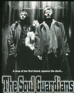
A drop of her first blood, spawns the devil...

韓国では初日異例の深夜0時封切にソウルだけで7万2000人が殺到。続いて封切9日で53万人の観客を動員。公開当時、韓国映画史上最長の興行記録を樹立する大ヒットとなった。オカルトアクション、ファンタジー、メロドラマなどの要素を併せ持つ超大作。原作は、実際に韓国で起きたカルト教団の集団自殺をモチーフにした大ベストセラー小説「退魔録」で、映画化にあたっては、韓国映画史上最高、最大のCG、特撮を駆使、華麗な映像でスペクタクルとラブストーリーが渾然一体となった世界を実現している。巻頭から重量感のある音と映像で展開する、(わが黒沢清の「地獄の警備員」を彷彿とさせる) 軍人ゾンビとのチェイス、ファイティングは韓国映画、アジア映画の粋を越え、一気にハリウッドを射程圏に捕える迫力で、度胆を抜く。