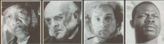
モーガン フリーマン