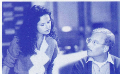
▲1976年、歌の才能に恵まれた少女との、淡い恋。