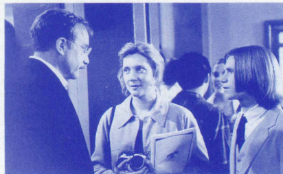
▲1980年、息子のコールら、耳の不自由な子のためのコンサート。

1995年/アメリカ映画/カラー作品/シネマスコープ/ ドルビー・デジタル/字幕：戸田奈津子 サントラ盤：(ポピュラー編)ポリドール(インスト編)ポリグラム 上映時間：2時間24分/配給：日本ヘラルド映画 HERALD