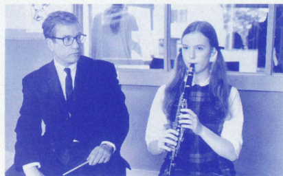
▲1965年、グレン・ホランド、高校の音楽教師となる。

「陽のあたる教室」は、ジョン・F・ケネディ高校の音楽教師、グレン・ホランド氏の愛に満ちた人生を、音楽家としての夢、生徒たちとの交流、淡い恋ごころ、そして妻や息子とのコミュニケーションを通して描き、見る人すべての心に素晴らしいシンフォニーとして響かせます。そして私たちは気づくのです。愛する人々こそが、胸を躍らせる音符となり、心にしみわたるメロディーとなり、人生という、感動に満ちた作品を奏でるということに。