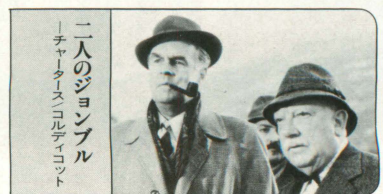
「二人のジョンブル チャーターズ・コルディット」

トッドハンター夫妻を名乗る火遊び旅行の男女。人目を避けてコンパートメントのシェイドを降ろしている。だが、男はイギリス軍のMPであり、女はドイツの人妻である。女は男の誠意のなさにただ泣くばかりである…。