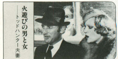
「火遊びの男と女 トッドハンター夫妻」

中年のイギリス婦人。ドイツ將軍の家で教師をしていた。上品で優しく、おしゃべりで陽気な婦人である。二日酔いのアマンドに何くれとなく気を使い、「ヘリマンズ・ハーバル」という紅茶をアマンドにすすめる…。