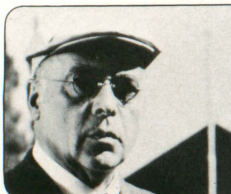
「ドクター・ハーツ 銀髪のドクター」

ライフ誌の記者兼カメラマン。スペインをはじめとしてヨーロッパを転々とした経歴を持つ。長身でガッチリした体格の大男でできるタイプではない。同じコンパートメントのドクター・ハーツとチェスに興じている…。