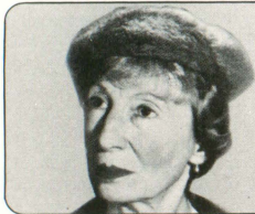
「バロネス・キスリング 氷の男爵婦人」

度胆抜くミステリー(デイリー・テレグラフ) / ヒチコックよりテンポの速いドラマの展開(ガーディアン) / シェファードとグルードのイキイキとした演技がこの作品を光らせている(デイリー・スター) / 美しい風景とSLが充分生かされたエレガントな作品(サンデー・ピープル) / ストーリーを知っていてさえドキドキしてしまう(デイリー・ミラー)