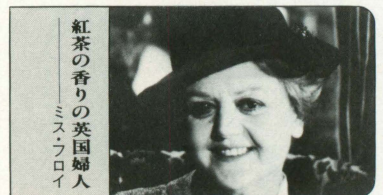
「紅茶の香りの英国婦人 ミス・フロイ」

遺産欲しさに結婚・離婚を繰り返しているアメリカの大富豪の一人娘。社交界のスクन्दル・メーカーでウイスキーに溺れている。肌も露わな白い夜会服に黒い毛皮のコートというファッションで列車に乗り込んでくる…。