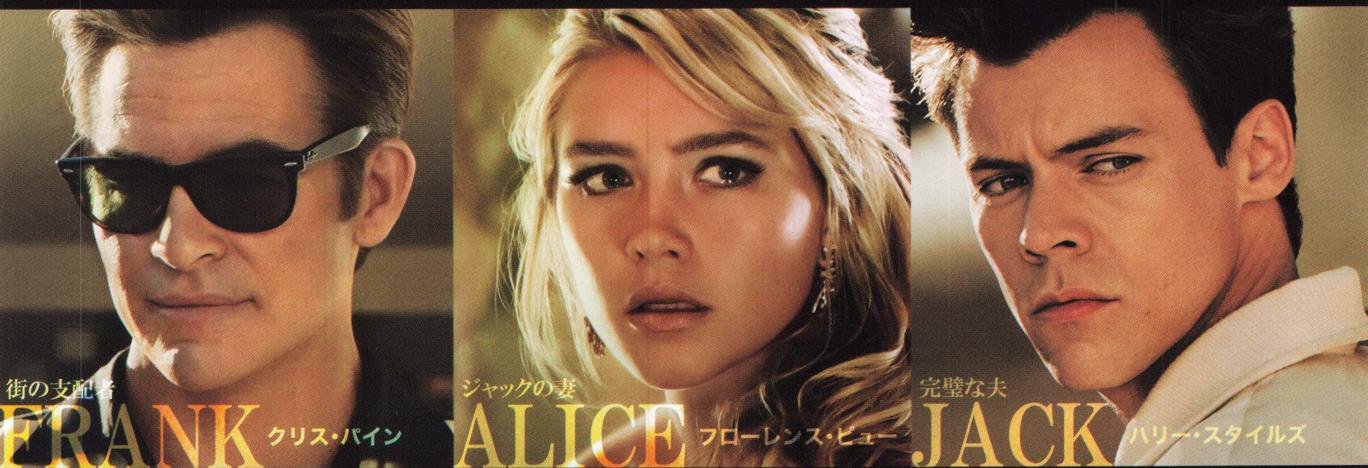
街の支配者 FRANK クリス・パイン