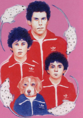
イラスト: 稲月ちほ

ニューヨーク・タイムズ紙をはじめ、全米有力紙がこぞって2001年ベストムービーに選出したあの話題作が、ついに日本公開! 天才監督ウェス・アンダーソンが描く、痛烈にして愛にみちた家族の物語に泣くか。ラコステ、アディダス、フィラなどの最先端ファッションにシビれるか。ジーン・ハックマン、グウィネス・パルトロウ、アンジェリカ・ヒューストンらアカデミー賞俳優の夢の競演に酔うか。心にキュンとしてみるサウンドトラックにハマるか。楽しみ方は自由自在、楽しさは無限大のテネンバウム家の扉が、もうすぐ開く。