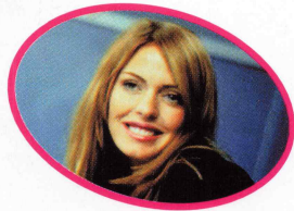
Illustration : ニノ宮 知子