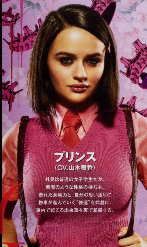
プリンス (CV.山本舞香)

外見は普通的女子学生だが、悪魔のような性格の持ち主。優れた洞察力と、自分の思い通りに物事が進んでいく“強運”を武器に、車内で起こる出来事を裏で掌握する。