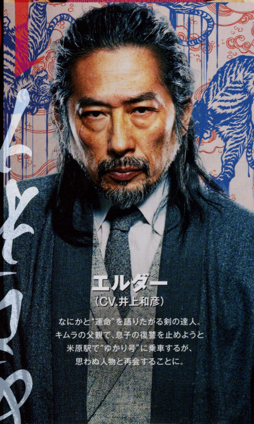
エルダー (CV.井上和彦)

息子をデパートの屋上から突き落とし重傷を負わせた犯人を突き止め、復讐するため“ゆかり号”に乗車する。