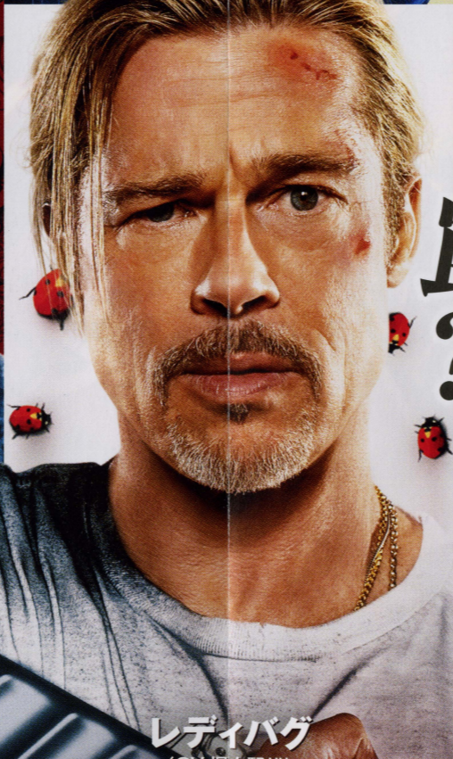
レディバグ (CV.堀内賢雄)

世界最大の犯罪組織を率いる冷酷非道な男。大量の暗殺者を引き連れて、京都駅でレディバグたちを待ち構える。