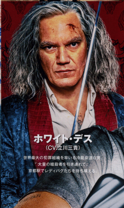
ホワイト・デス (CV.立川三貴)

なにかと“運命”を語りたがる剣の達人。キムラの父親で、息子の復讐を止めようと米原駅で“ゆかり号”に乗車するが、思わぬ人物と再会することに。