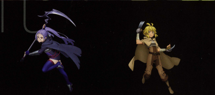
アスナ / 戸松遥

第一層以来、キリトとコンビを組んで《SAO》の攻略を続ける。今ではゲームの世界にも慣れてきて、攻略集団の中でもトッププレイヤーとなっている。