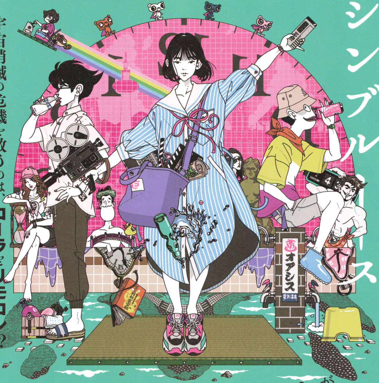
illustration / Yusuke Nakamura

「 四畳半神話大系 」×「 サマータイムマシン・ブルース 」が 悪魔的融合 浅沼晋太郎 坂本真綾 吉野裕行 中井和哉 諏訪部順一 甲斐田裕子 佐藤せつじ 本多力(ヨーロッパ企画) 原作◎森見登美彦/著、上田誠/原案「四畳半タイムマシンブルース」(角川文庫/KADOKAWA刊) 監督◎夏目真悟 脚本◎上田誠 (ヨーロッパ企画) キャラクター原案◎中村佑介 音楽◎大島ミチル アニメーション制作◎サイエンス SARU 主題歌◎ASIAN KUNG-FU GENERATION「出町柳パラレルユニバース」(Ki/oon Music) 配給：KADOKAWA アスミック・エース ©2022 森見登美彦・上田誠・KADOKAWA /「四畳半タイムマシンブルース」製作委員会