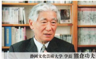
静岡文化芸術大学 学長 熊倉功夫