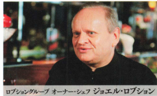
ロブショングループ オーナー・シェフ ジョエル・ロブション