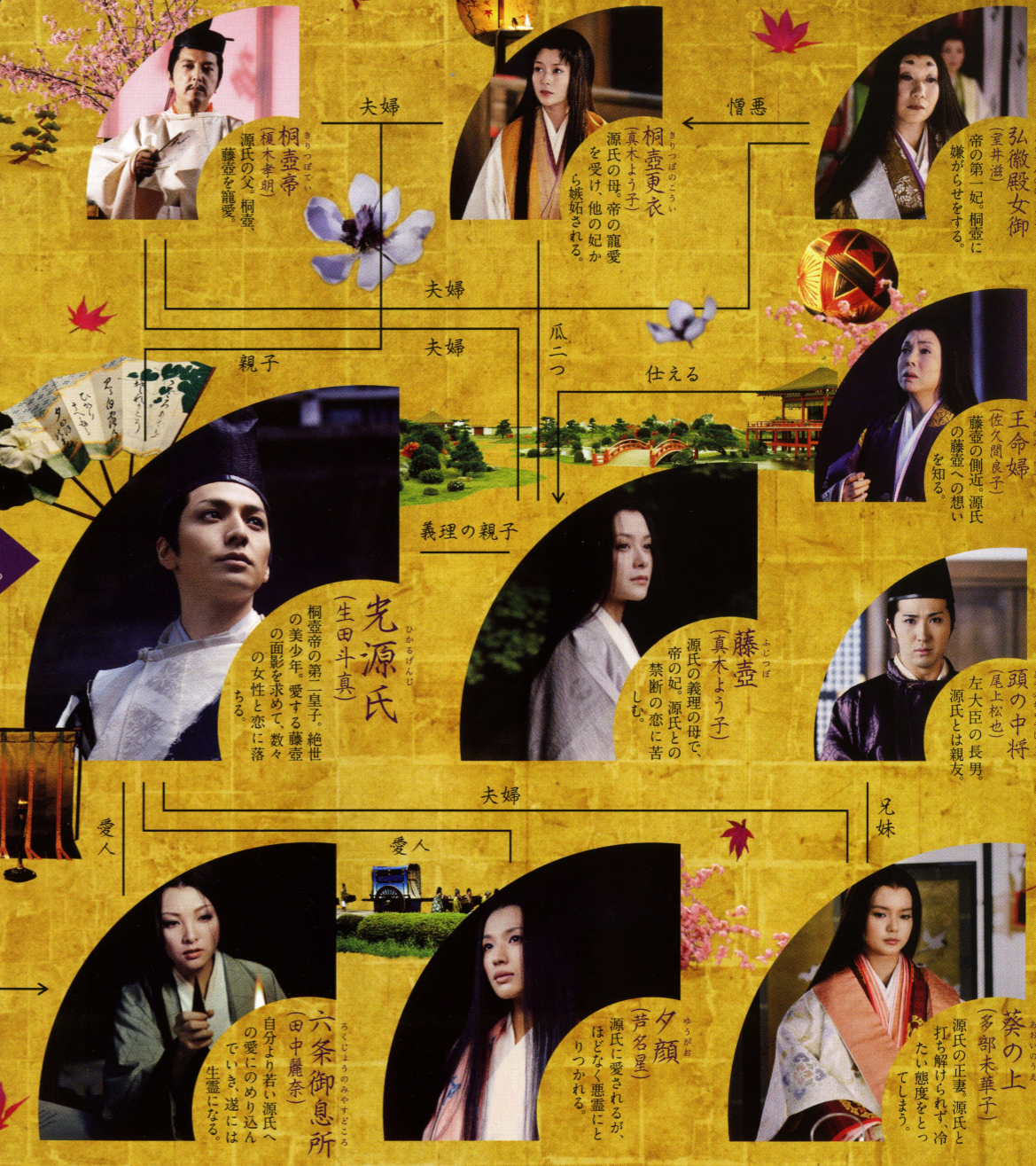
物語 — 光源氏の世界 —