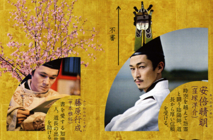
現実 — 紫式部の世界 —

[STORY] 何故、紫式部は「源氏物語」を書かねばならなかったのか—— 絢爛豪華な平安王朝の時代。時の権力者・藤原道長は、娘・彰子に帝の心向けさせるために、紫式部に物語を書くよう命令する。物語の主人公・光源氏は、宮中の女性たちの憧