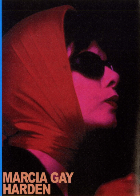
MARCIA GAY HARDEN