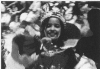
ダルエ・マルンゴの子供たち ダンスや劇などを学んで、 人生の豊かさを学ぶ子供たち