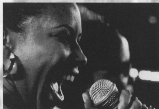
マルガレッチ・メネーゼス 80年代にデビッド・バーンのワールドツアーに 参加したこともある、ハイア出身の女性シンガー