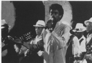
セウ・ジョルジ 「シティ・オブ・ゴッド」 ブラジリアン・ファンクを代表するバンド、 ファロファ・カリオカの元リーダー。 彼には路上生活者としての過去があった...