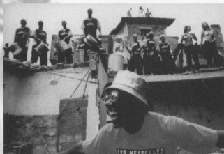
ファンキン・ラタ サンバ・ソウルといえばこのグループ。 ジェームス・ブラウン「セックス・マシーン」を 引用した豪快なファンクを披露