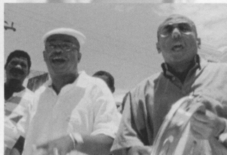
カジュ・アンド・カスターニャ タンバリンのリズムに乗せて、日常を歌うコンビ