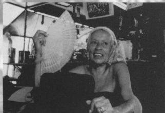
ヴェーリャ・グアルダ・ダ・マンガイラ 最古(1928年創立)にして、 カーニバルで何度も優勝している サンバ・チームの長老たちが集うグループ