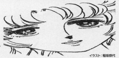
イラスト：稲坂啓代

脚本：阪本順治／宇野イサム プロデューサー：椎井友紀子 音楽・主題歌「顔」作詞／作曲、唄：coba 製作：松竹株式会社／株式会社衛星劇場／株式会社毎日放送 株式会社セディックインターナショナル／KIHIO 配給：東京テアトル株式会社 宣伝・配給協力：株式会社ザナドゥー 1999年／日本／カラー／2時間3分／ヴィスタサイズ／DTSステレオ