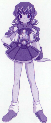
【花小金井ひばり】1998年3月3日生まれ。血液型O。身長142cm。TV版より背も伸び、精神的にも大人に近づいた(?)。ドジだが優しいコで、人をひきつける魅力がある。かつて、王子様にパタPIのダンスケをもらった。