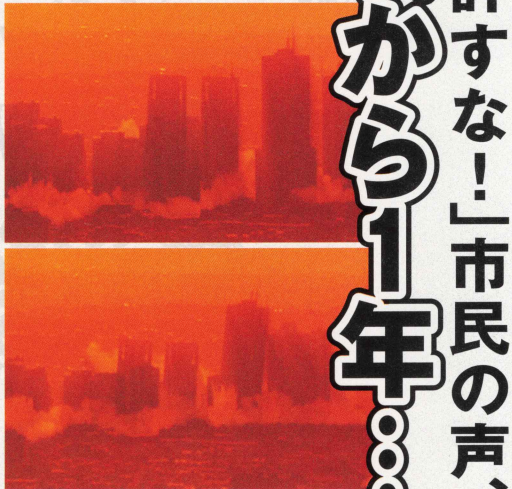
爆破により煙をあげて沈むビル群

国際指名手配テロリスト 30数名と潜伏 必ず、殺せ 首都爆破犯、ワイルドセブンのリーダー・七原秋也とテロリスト達の居場所が、ついに発見した! 絶海の孤島、戦艦島にアジトを作り立て籠もっている模様。又、テロリストグループハワ