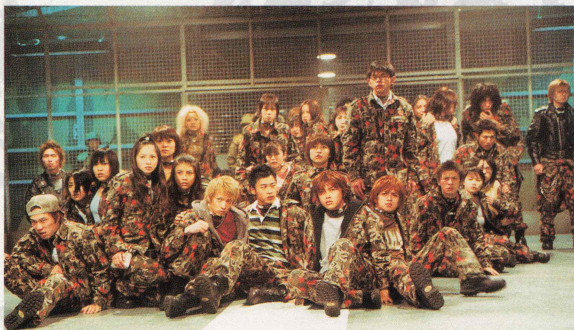
選ばれた町立鹿之砦中学校3年B組の生徒達

先程の臨時国家安全保障推進委員会の承認を得て、「新世紀テロ対策特別法 通称BRⅡ」が正式に施行されることとなった。第1回目の実行部隊として町立鹿之砦中学校3年