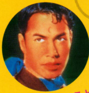
無口なガンマンこと 快盗ブラック・タイガー