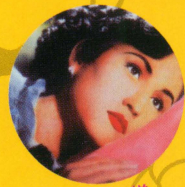
勝気なお嬢様 ラムバイ