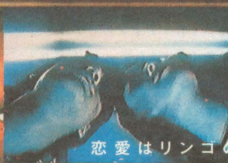
恋愛はリンゴの皮をむくのと似たってさ