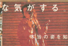
本当の姿を知りたくなった