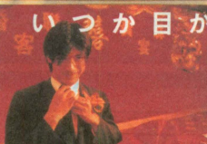
いつか目が覚めるような気がする。