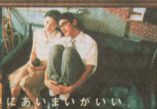
時はあいまいがいい

エグゼクティブ・プロデューサー: チャン・イーチェン プロデューサー: ウォン・カーウアイ、大里洋吉 アソシエイト・プロデューサー: 森重晃、ジャッキー・パン プロダクション・コーディネーター: ボール・チェン 美術: マン・リム・チャン 編集: チャン・キー・ホップ 音楽: カール・ウォン 脚本: オーシャン・チャン、イップ・リム・サム サウンドトラックの発売: ロック・レコード(株)、販売: 日本コロムビア(株) 製作: アミューズ、Block 2 Pictures ノベライズ: 角川文庫 配給/提供: アミューズ