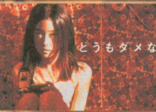
どうもダメな気がする

プロデューサー: ウォン・カーウアイ 監督: エリック・コット 撮影: クリストファー・ドイル