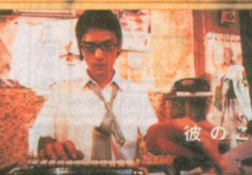
彼のことで泣いたことはない