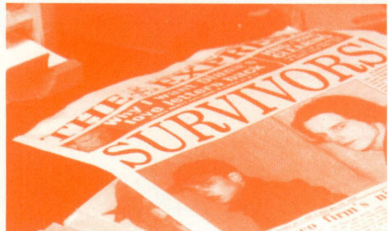
#1 全国紙の一面を飾る