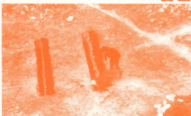
#11 地球に緑を取り戻す