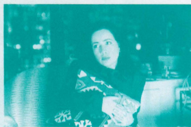
THE MATCH MAKER

*株式会社オーエムエムジーの調査より(99年1月に首都圏および阪神圏で20代~30代の働く女性400人を対象に実施)