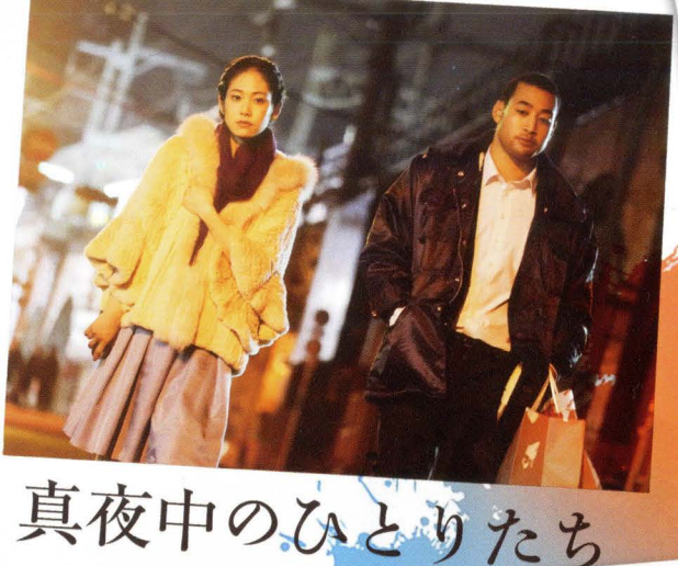
真夜中のひとりたち