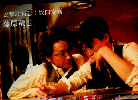
太宰の同志：坂口安吾 藤原竜也

“世界で最も売れている日本の小説”、「人間失格」。その小説より遥かにドラマチックだった〈誕生秘話〉を、世界屈指の写真家、蜷川実花が、構想に7年を費やし大胆に映画化！脚本に『紙の月』の早船歌江子、撮影に『万引き家族』の近藤龍人、音楽には世界的巨匠・三宅純を迎え、日本映画界最高峰のチームが集結。ゴージャスでロマンティックな唯一無二の蜷川ワールドをさらに大きく進化させた。