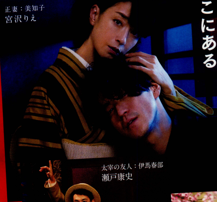
スター作家：太宰治 小栗旬