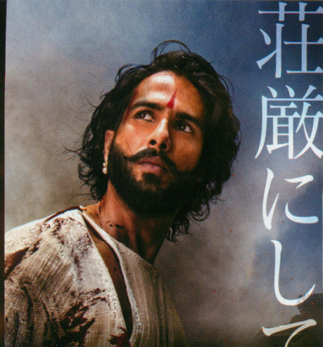
誇りに生きる王：ラタン・シン