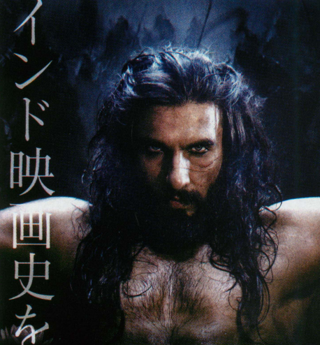
野望に生きるスルタン：アラウッディーン