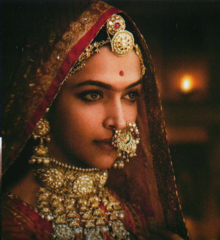
愛に生きる王妃：パドマーワティ