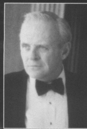
アンソニー・ホプキンス