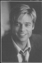
ブラッド・ピット