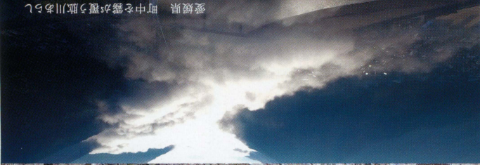
愛媛県 町中を霧が覆う肌川あらし