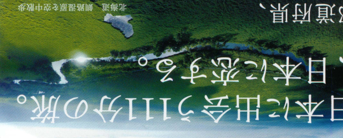
北海道 銅路温泉を空中散歩

後世に遺したい、美しい日本に出会う111分の旅。 あなたはきっと、日本に恋する。 全国47都道府県、 奇跡のような絶景を網羅