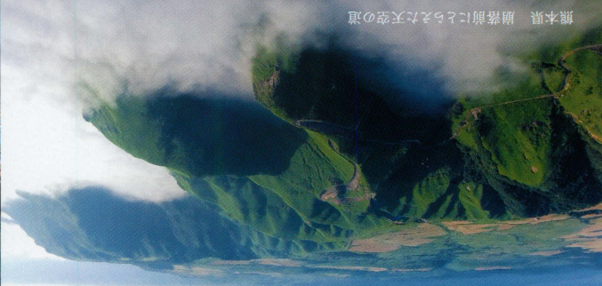
熊本県 扇前にとらえた天空の道

製作8年。日本の精神と絶景の“ベスト盤”を、スクリーン上で。 数年間に一度だけ、「一期一会」でしか出会えない神々が宿る美しい瞬間があります。本作は8年の歳月をかけてその瞬間を追い求め、全国47都道府県・200箇所以上で撮影された映像を厳選し、迫力の4K解像度*で映画化。東京オリンピック*に向け「ニッポン」が注目されている今、私たちが知っておきたい、次の世代に伝えていきたい本当の日本の美しさがここにあります。 長い歴史の中で生まれた日本人ならではの自然感にフキカスする「日本人の精神」、世界に類を見ない豊かな気候風土が生み出す季節の変化を巡る「日本の四季」、そして、日本列島を南から北へ、映像作家たちが「奇跡的」にとらえることに成功した瞬間を紡いでいく「一期一会の旅」。日本の魅力が凝縮された3部構成の贅沢な旅を、映画館の大スクリーンとサラウンドで体感してください。 (*4K上映は一部対応劇場のみ)