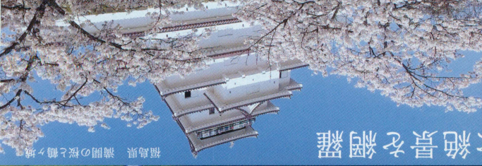
福島県 満開の桜と鶴ヶ城