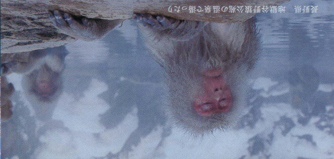
長野県 地獄谷野猿公苑の温泉で湯ったり