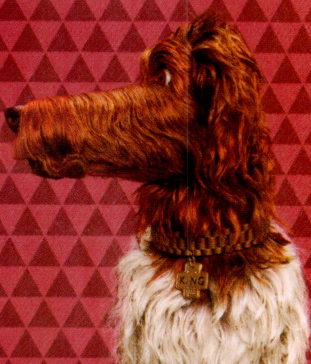
Bob BALABAN (King) ボブ・バラバン (キング)