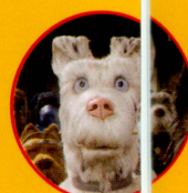
スポッツ (リーブ・シュレイバー) 犬ヶ島に追放された、 アタリの元護衛犬。