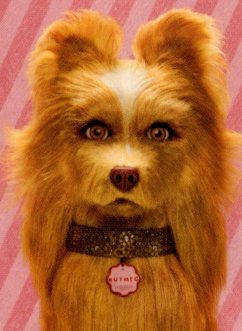
Scarlett JOHANSSON (Nutmeg) スカーレット・ヨハンソン (ナツメグ)