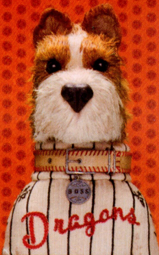
Bill MURRAY (Boss) ビル・マーレイ (ボス)