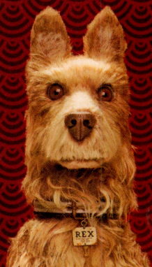
Edward NORTON (Rex) エドワード・ノートン (レックス)