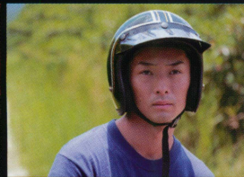
秘かに真海を想う青年、真海も兄のように慕っていたが… リョウ/風間晋之介