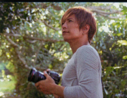
東京で活躍する世界的に有名な写真家、沖縄で初めて出逢った衝撃の愛 大山光/GACKT

世界を舞台に活躍する写真家の大山光(GACKT)は、よく引き締まった身体、優しい面影をもつ美しい男である。東京での華やかな暮らしに不在感を感じている。ある日、救いを求めて沖縄を訪れる。そこで出逢った澄み切ったイノー(サンゴ礁の浅瀬)から突然出現した美しい姿態の美少女、石垣真海を探し歩く。「カーラヌカン」という不思議な祈りの声に誘われ「ニライカナイ海の祭り」で真海を見つける。三日月の夜に「写真を撮らせて欲しい」と説得し、八重山地方を背景に撮影していた。突然、強い太陽光線が大山を突き刺し、目の前が真っ白になる。気がつくと、真海が忽然と消えてしまっていた。美少女はまるで光に吸い込まれるように消えてしまったのだ。大山は琉球から綿々と続く自然信仰の力に押し流されて、訳のわからないまま、八重山の奥深くで消えた少女を探し続けてしまう…。